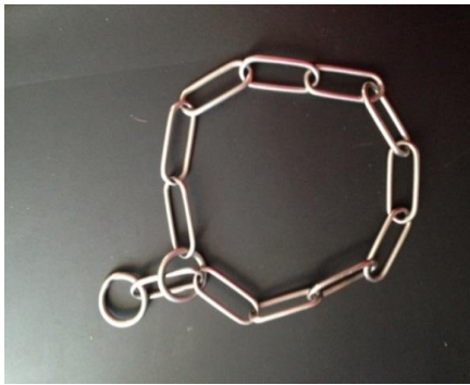
Le collier étrangleur